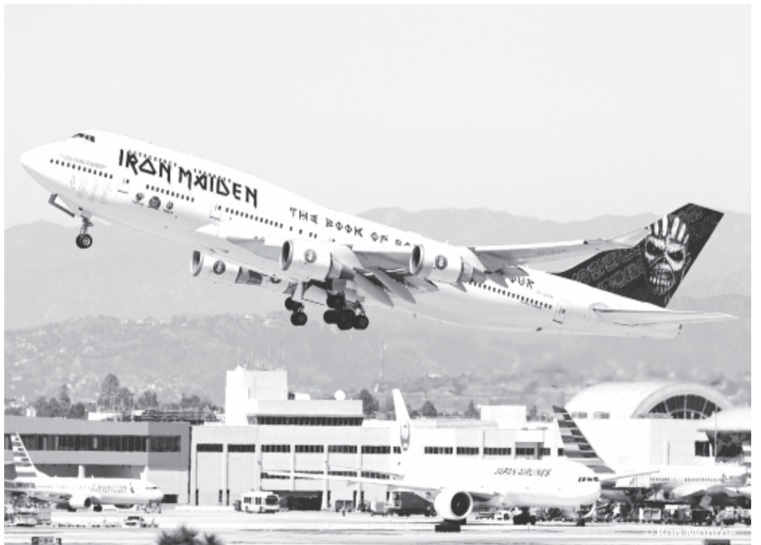
Az Iron Maiden saját, Jumbo 747-es turnéjáró repülőgépe, az Ed Force One. A gép kapitánya: Bruce Dickinson.

Minden idők egyik legsikeresebb együttesének – amely 1975-ben alakult – lemezeiből eddig világszerte 90 millió példány fogyott el. Az Iron Maiden tizenhatodik stúdióalbuma 2015-ben jelent meg Book of Souls címmel. Több mint kétezer koncertet adtak, legutóbb 2016-ban jártak Magyarországon, akkor Sopron volt a helyszín, és idén is a VOLT Fesztivál nagyszínpadán koncerteznek június 28-án.