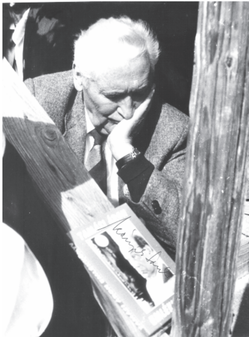
Fotó: Vajda György

lansága folytonos megújulásra ösztönzi a művészt, és ez a törekvése mit sem veszített intenzitásából, miután Vásárhelyről áttelepedett az anyaországba. Ellenkezőleg, amint telt az idő, és bővült a művészi eszköztára, úgy mutatta fel festőként, rajzolóként, metszetkészítőként, szobrászatban is jártas vizuális művészként, könyvillusztrátorként, ötletes könyvtervezőként újabb meg újabb arcait. A mostani látványra talán mégsem gondolt a közönség, lévén szó jubileumról, arról, hogy 60. születésnapja készítette az alkotót a pár hónappal ezelőtti debreceni, illetve a jelenlegi itthoni bemutatkozásra. Ilyen alkalmakkor