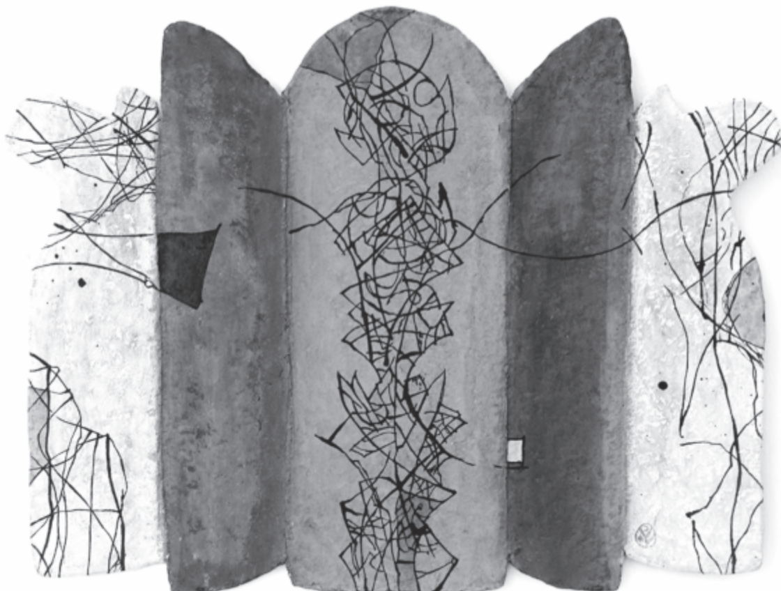
Mellékletünket Vincze László alkotásaival illusztráltuk