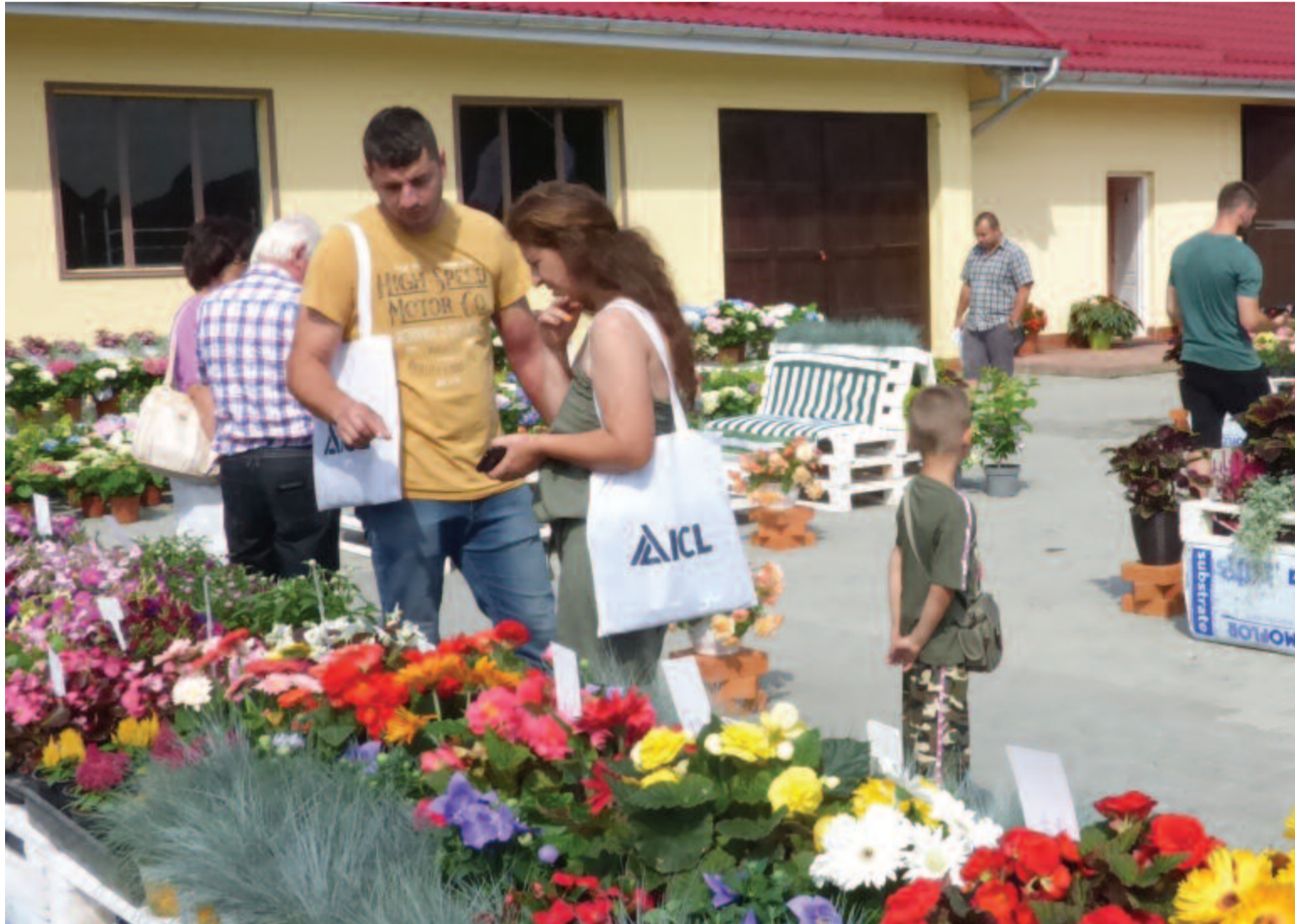
Több mint százféle virágot állított ki csütörtökön a Fariker

Csütörtökön a nyárádszeredai Fariker cég ismét nagyszabású virágbemutatót és szakmai ismertetőt tartott, amelyre az ország számos pontjáról érkeztek érdeklődők.